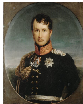
Friedrich Wilhelm III

Tyskland vender tilbage i den historiske udstilling i 2018. I anledning af 100-året for afskaffelsen af det tyske monarki i 1918 vises udstillingen om slægten Hohenzollern med primær fokus på Frederik den Store og Kejser Wilhelm II.